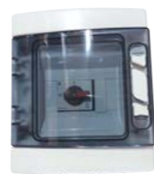
Coffret de protection DC