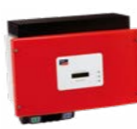
ou onduleur central SMA