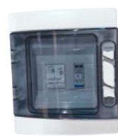
Coffret de protection AC Suivi de production ECU : En option